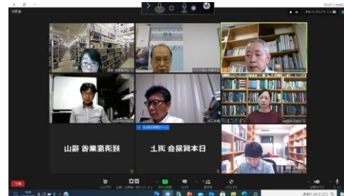
第1回研究会開催の様子